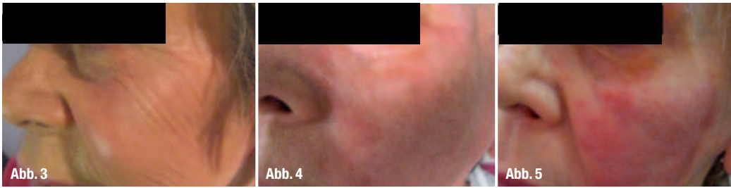
Abb. 3_ Eine 68 jährige Patientin mit ausgeprägten Fältchen periorbital und auf den Wangen.