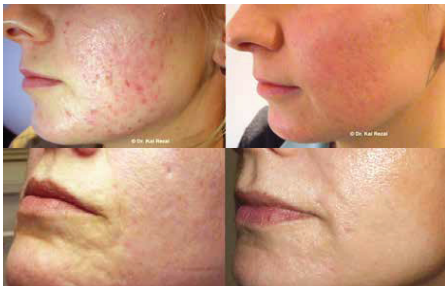
Abb. 2a+b: Aknenarben vor und nach Mikroneedling