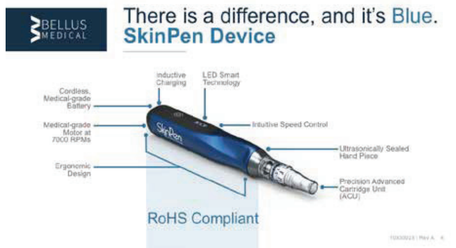
Abb. 3: Der SkinPen® Precision.