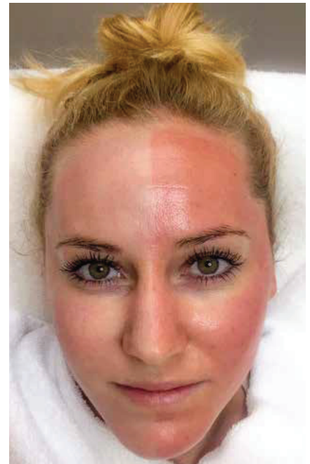
Abb. 6: Der Effekt mit epi nouvelle+ naturelle (Seitenvergleich).

Nicht nur nach dem Mikro-needling, sondern auch nach anderen ästhetisch-dermatologischen Eingriffen ist die Haut beansprucht, braucht Ruhe und benötigt Kühlung und Feuchtigkeit. Die Zugabe von Konservierungsmitteln und künstlichen Lösungen ist nach einer solchen Behandlung nicht zu empfehlen. Durch seine natürliche Zusammensetzung, frei von Konservierungsmitteln, die enorm hohe Feuchtigkeit und die konstante Kühlung der Haut, ist epi nouvelle+ naturelle (Hersteller: JeNa-Cell, Jena, Deutschland) sehr gut geeignet, um die Regeneration der Haut zu unterstützen.