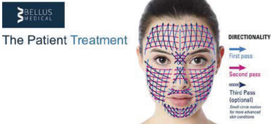
Abb. 5: Schema der Durchführung der Behandlung.

geringem Schmerzempfinden. Das klinisch getestete Design sorgt für ergonomische Flexibilität. 14 glatt geschliffene Nadeln aus Edelstahl erzeugen 98.000 Mikroverletzungen pro Minute und führen zu einer erhöhten Effizienz. Die Nadeltiefe ist je nach Behandlungsareal und -tiefe, individuell einstellbar (0,25–2,5 mm), so dass auch dickere Haut und Narben gut behandelt werden können.